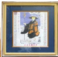
付属品 四国八十八ヶ所 霊場順拝記念 色紙(額入り)