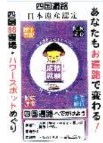
パワースポットめぐり ¥1,000