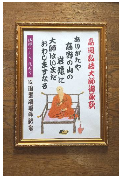
高祖弘法大師御詠歌額 ¥3,000