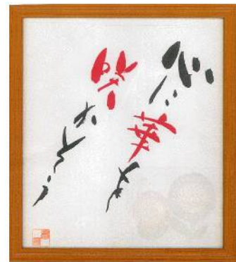
選べる 座右の銘 色紙(額入り) ¥1,400