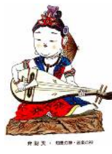
ぬりえ 弁財天~寿老人 ¥ 900~¥1,000