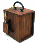
唐木 ミニ遊山箱 ¥19,440