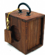
唐木 ミニ遊山箱 ¥19,440