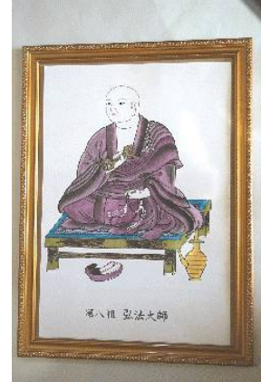
真言密教の伝持八祖大師の御尊影 ¥50,000