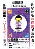
パワースポット めぐり ¥1,000