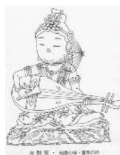
ぬりえ 弁財天~寿老人 ¥ 900~¥1,000